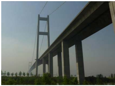
写真-6 潤揚大橋(吊橋) (Photo-6 Runyang Bridge) (suspension bridge portion)