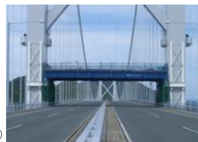
写真-3 路面防護工 (Photo.3 Protection for road )