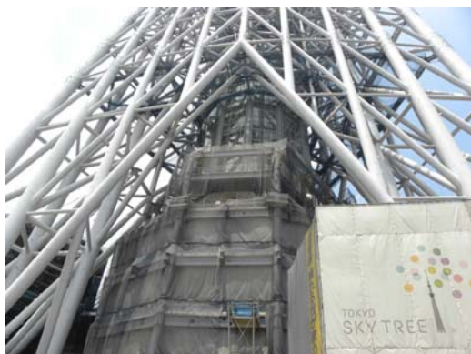
写真-5 タワーの基部 (Photo-5 Tower base)