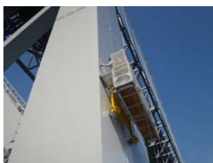
写真-2 磁石車輪ゴンドラ (Photo.2 Magnetic Wheel Gondola)