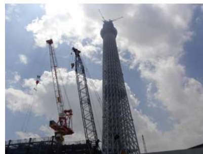
写真-4 東京スカイツリーの建設状況(5月末) (Photo-4 Construction stage (As of the end of May))

(Original information was provided in Japanese by Tobu Tower Skytree Co., Ltd. and Obayashi Corporation)