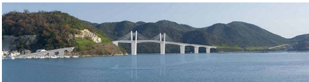
図-2 日生大橋(仮称)完成予想図 (Fig.2 Image of Hinase Bridge (tentative name))