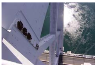
写真-1 鋼製カバーの腐食 (Photo.1 Corrosion on steel cover)

現在、2 基の主塔のうち 1 基(2P:向島側)は完了し、残る 1 基(3P:因島側)も塗替塗装作業自体は完了し、路面防護工の撤去のための準備作業中です。