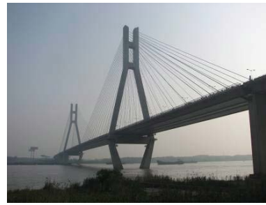
写真-7 潤揚大橋(斜張橋) (Photo-7 Runyang Bridge) (cable stayed bridge portion)