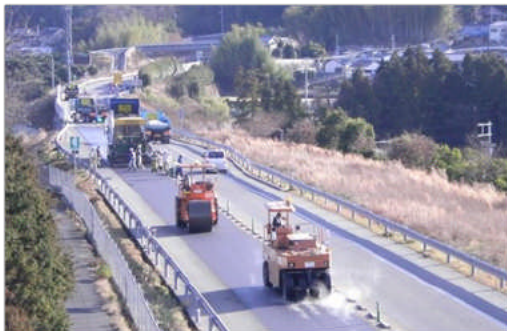
舗装補修(西瀬戸自動車道)