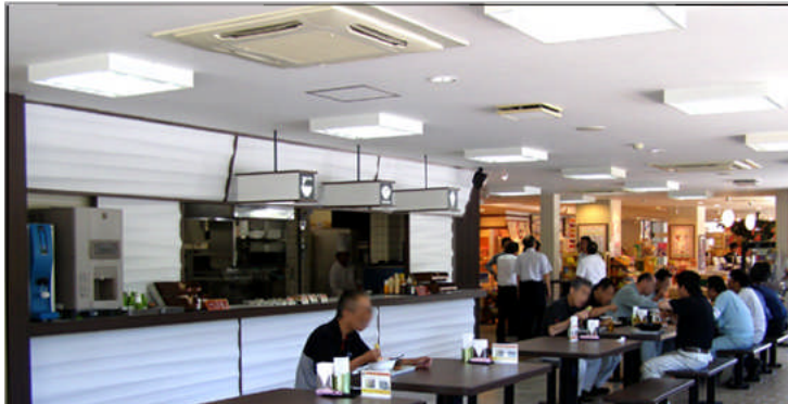
リニューアル後の淡路島南PA(上り)休憩施設