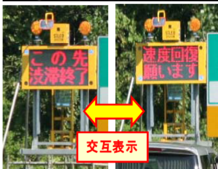
①上り坂等での速度低下注意喚起