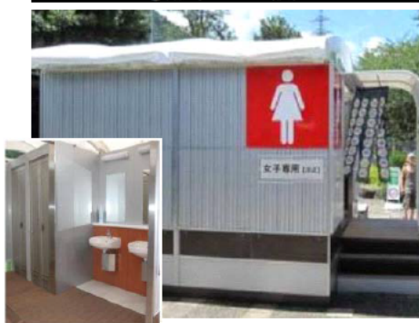
④臨時トイレの設置