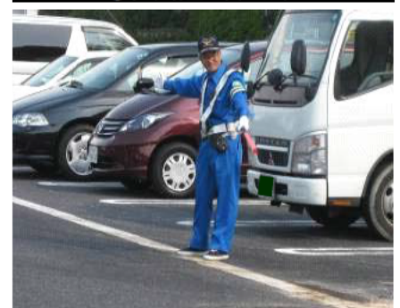
③駐車場整理員の配置