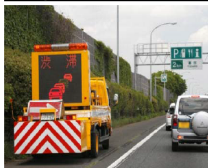
②渋滞末尾への追突注意喚起