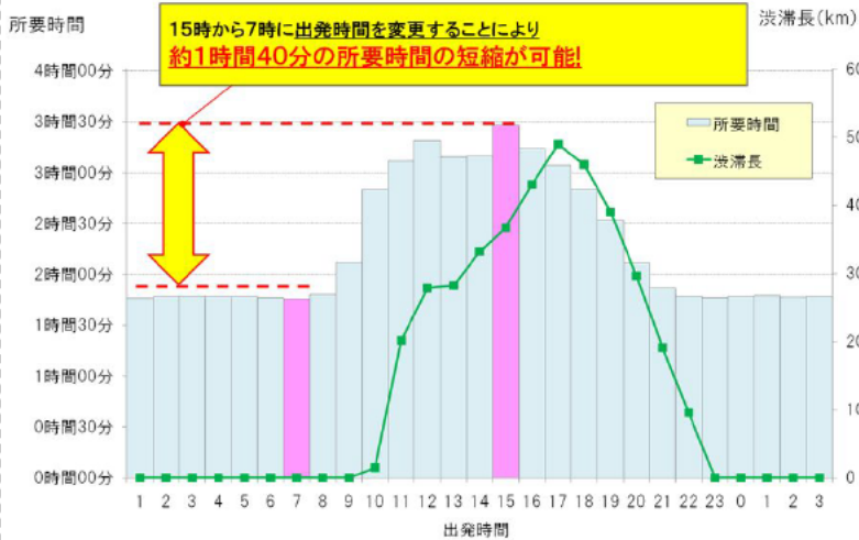
《平成25年1月3日(木)の東名の事例》

例えば、H25年1月3日(木)に東名の静岡ICから東京TBまで利用した場合では、 出発時間をずらすことで渋滞を避けることができ、所要時間の短縮が可能 でした。(下表参照)