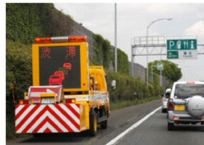
渋滞末尾への追突注意喚起

交通混雑期においては事故が多発します。高速道路をご利用される際は「 全席シートベルトの着用 」と「 こまめな・早めの休憩 」などを心掛けていただくようお願いします。また、高速道路上では渋滞末尾への追突注意喚起を案内しておりますが、前方に注意し、ご走行願います。