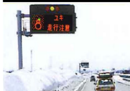
情報板による注意喚起

冬の雪道は、乾燥路に比べて滑りやすくなっています。 このような路面では『急』の付く運転(急ハンドル、急加速、急ブレーキ)は大変危険です。 速度を控えめ に、 十分な車間距離 をとって安全運転を心掛けてください。