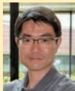
沖縄科学技術 大学院大学 研究員