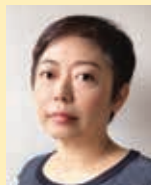
東京国立 近代美術館 主任研究員