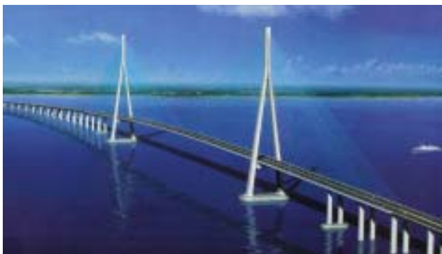
完成予想図 (パンフレットより) Computer Graphic of Suzhou-Nantong Yangtze River Bridge