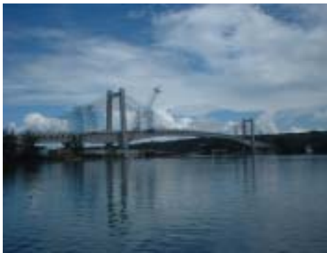
日本パラオ友好橋 (Japan-Palau Friendly Bridge)

橋梁形式:3径間連続複合エクストラド-スト橋 支間割 :82m+247m(内、鋼桁部82m)+82m 車線数 :2車線(歩道付き) 主塔形式:H形RC構造 H=27m 桁形式 :PC桁部 1室箱桁(H=3.5~7m) 鋼桁部 1室箱桁(H=3.5m) (以上は、日本工営(株)からの情報による)