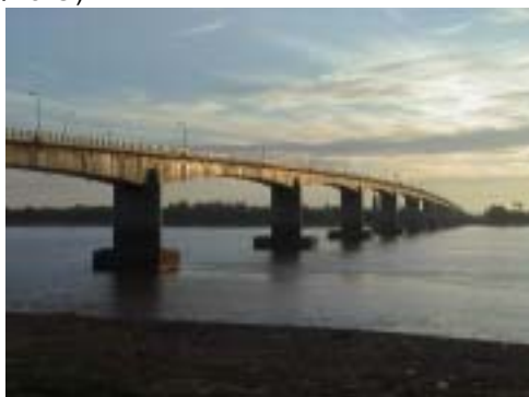
きずな橋 (Spin Kizuna)