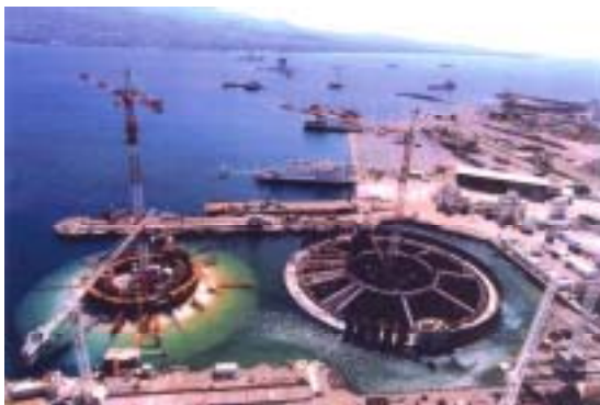
M1 (Left) , M2 (Right) ピア

(以上は、アンジェロセック(株)と Gefyra S.A. のホームページからの情報による。)