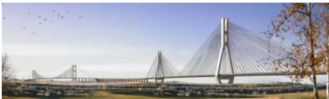
完成予想図 (Computer Graphic)