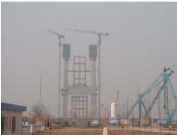
主塔施工状況 (Construction of Main Tower)