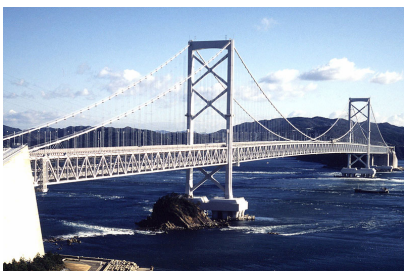
写真-1 大鳴門橋 (Photo.1 Ohnaruto Br.)

現在までに吊橋・斜張橋は、概略の照査、検討を完了しています。局部的な損傷は生じますが、橋梁全体としては耐震性を確保しており、引き続き詳細な耐震性能についての検討を進めて行く予定です。写真-1 に長大吊橋である大鳴門橋を示します。地震時の多柱基礎部のせん断耐力確保のため、既設の外鋼管を保護するための防食工事を現在実施中です。