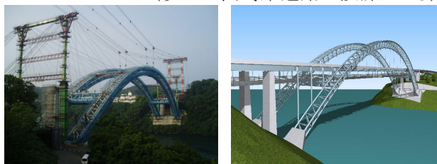
写真-2 アーチ閉合状況