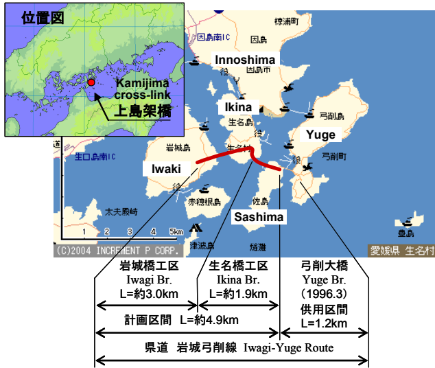
図-3 位置図 (Fig.3 Location)