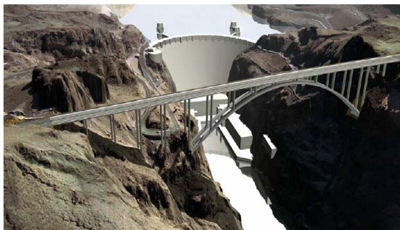
図-2 完成予想図 (Fig.2 Computer Graphic of Colorado River Bridge)

operation. Repainting work for tower has started since 2004. A gondola with the magnet wheel is adopted, and an automatic coating device is partly introduced to improve working condition and enhance net working rate.