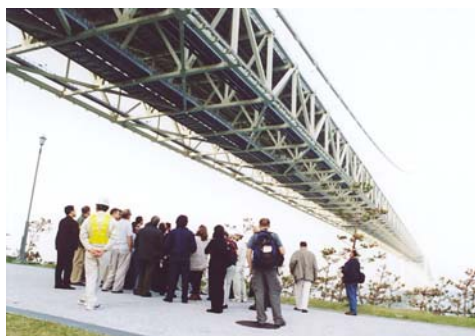
写真-2.2 明石海峡大橋見学 (Photo.2.2 Technical Visit)