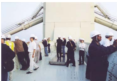
写真-2.1 明石海峡大橋見学(塔頂) (Photo.2.1 Technical Visit)

The next International Conference on Bridge Maintenance, Safety and Management will be held in Porto, Portugal, in July, 2006.