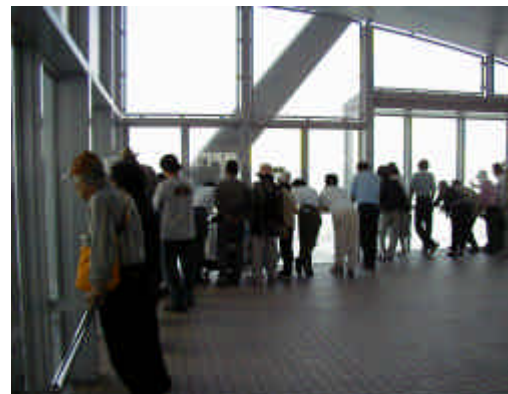
展望室から渦潮を眺める観光客 Tourists seeing whirlpool from observatory room

The visitors amounted to 270 thousands at the end of June 2000, with the average of 3,900 per day and the maximum of 13,200 per day.