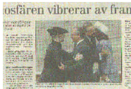
開通を伝える地元新聞 Newspaper reporting the opening of Øresund Link