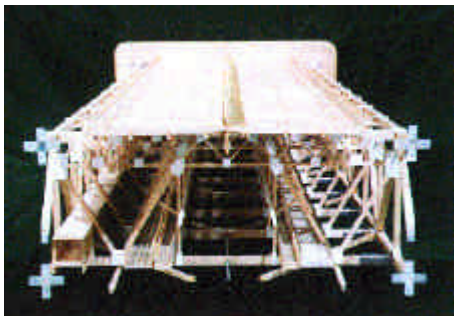
遊歩道を添架した大鳴門橋の風洞試験模型 Wind tunnel test model of Ohnaruto Bridge carrying a promenade

本施設のオープン後2ヶ月間の入場者数は、1日当たり平均で3,900人、最大で13,200人、延べ27万人(6月末時点)を記録し、連日大勢の観光客で賑わっています。