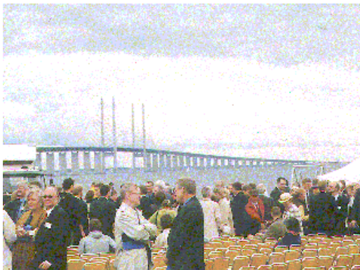
開通式会場の模様 Place for Inauguration ceremony

デンマークとスウェーデン間のオーレスン海峡を、沈埋トンネル、人工島、橋梁で結ぶ全長16 kmのオーレスンリンクの開通式が7月1日に行われました。本四公団に対しても事業主体のオーレスンコンソーシアムから開通式への招待状が届き、北川長大橋技術センター長が式典に出席しました。当日の15時に、デンマーク王女のマーガレット2世を乗せた特別列車がコペンハーゲン駅を、また、スウェーデン国王のグスタフ16世を乗せた特別列車がオーレスン海峡に向かって出発しました。両国の特別列車は海峡部に作られた人工島で出会って連結された後、スウェーデン側の橋梁が取り付くラーネッケンに設けられた開通式会場に向かいました。約3000人の招待客が待つ会場に両国のローヤルカップルと首相夫妻一行が到着してから、開通式典が始まりました。ミュージカル風の余興に引き続き、マーガレット王女、グスタフ国王、また、両国首相の祝賀スピーチが行われ17時30分頃に式典は無事終了しました。その後、自動車とバスによるパレードがデンマーク側に向かい、先頭車が国境に張られたテープをカットしました。18時からはデンマークのカストラップにおいてレセプションが行われましたが、23時から一般の交通に供用されました。オーレスンリンクの開通により、今後、北欧諸国の経済的、文化的交流が一層促進されることが期待されます。