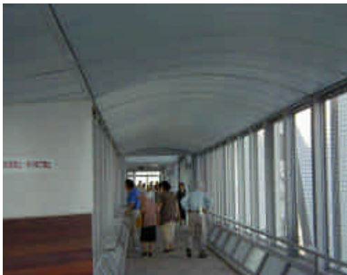
遊歩道を歩く観光客 Tourists walking on promenade