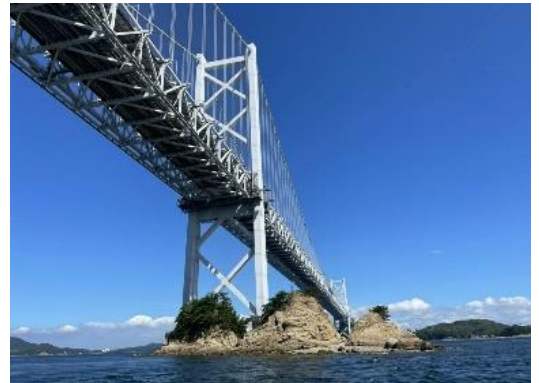
瀬戸大橋ぐりクルーズダイヤ