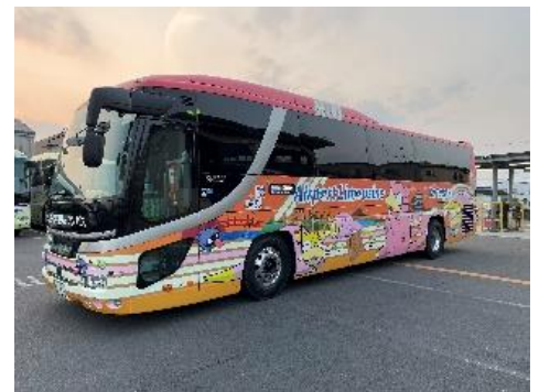
シャトルバスダイヤ

○与島PAー第2駐車場間のシャトルバス運行 ヤドンバスが与島PAー第2駐車場間を運行！島旅クルーズや ほんのもり号に行かれる際はぜひヤドン号の無料シャトルバスを ご利用ください！