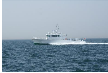
高松海上保安部 巡視船 みねぐも