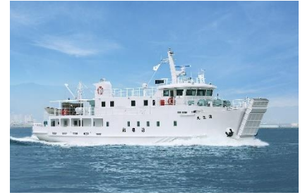
香川県済生会病院 済生丸

※各イベントの料金、応募方法、時間等詳細は後日「 せとうち島旅フェス 2025 特設サイト 」にてお知らせします。