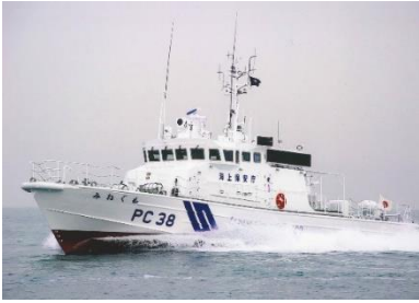
香川県 漁業指導船 ことぶき