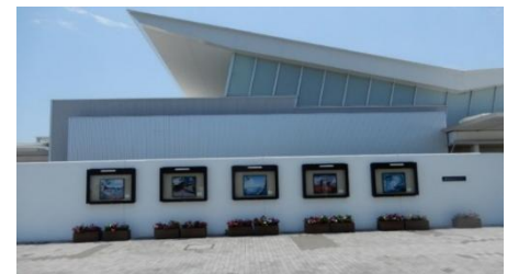
「橋の見える丘ギャラリー」