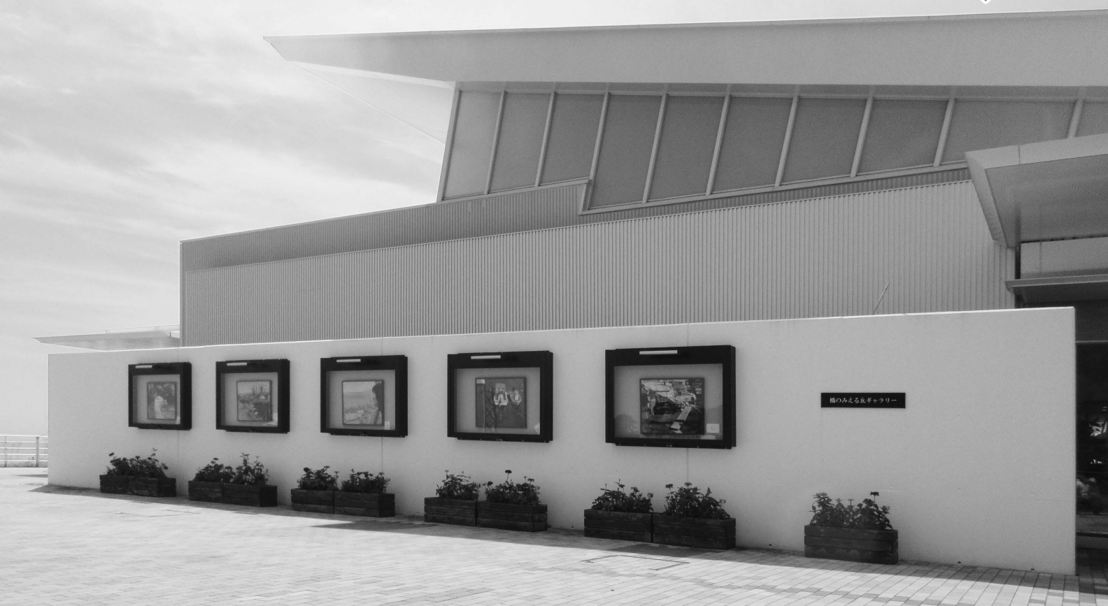
「橋の見える丘ギャラリー」(淡路サービスエリア<上り>)