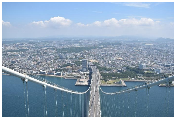
神戸側主塔(2P)からの風景（神戸側を望む）

○ 4 月～11 月、2027 年 3 月 のうち明石海峡大橋塔頂体験ブリッジワールド事務局が指定する日