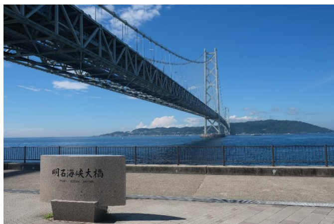
明石海峡大橋（神戸側より）