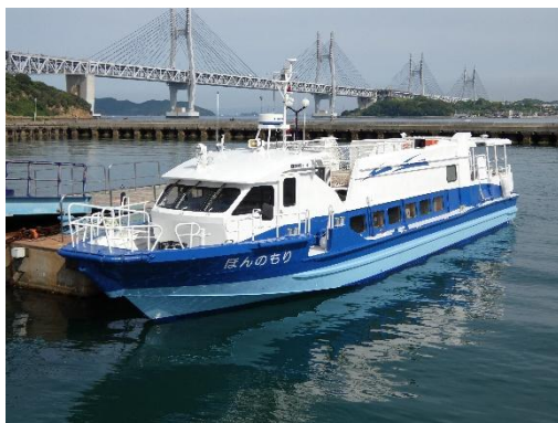
はたらく船展(せとうち島旅フェス 2025)