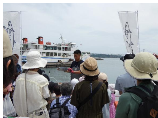
サテライト会場（本島）のイベント（せとうち島旅フェス 2025）