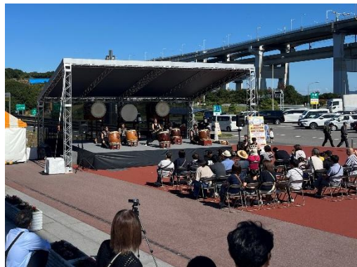
ステージイベント(せとうちマルシェ 2024)

メイン会場にステージを設けて、瀬戸内の島々や「せとうちマルシェ」出店自治体などの魅力発信・情報発信を行うとともに、イベント会場全体の一体感を演出します。