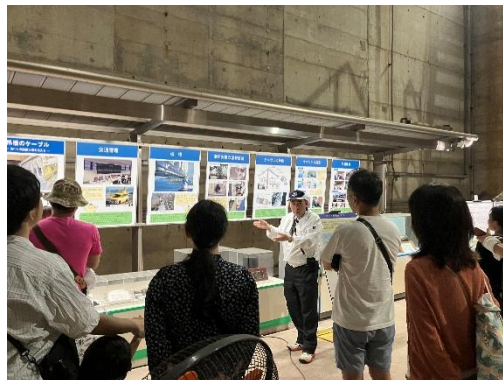
インフラツアー（せとうち島旅フェス 2025）

せとうち島旅フェス 2026 では、昨年のプログラムに加えて、新たに瀬戸内の島々の魅力を発見できるようなプログラムも検討しております。どうぞ楽しみに！