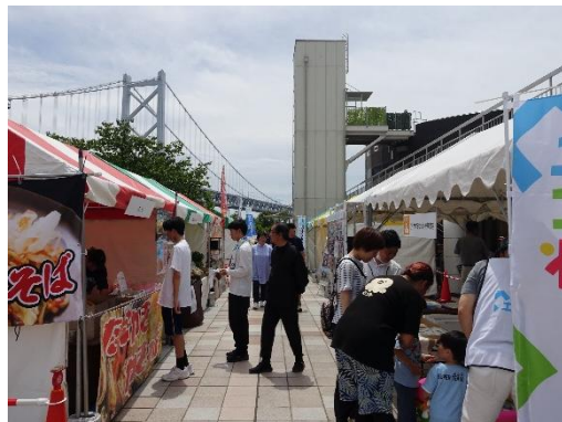
せとうちマルシェ(せとうち島旅フェス 2025)

瀬戸内のグルメや物産、観光 PR ブースが大集合します！島々の文化や自然を感じながら、食べて、見て、体験できる特別なひとときをお楽しみください。