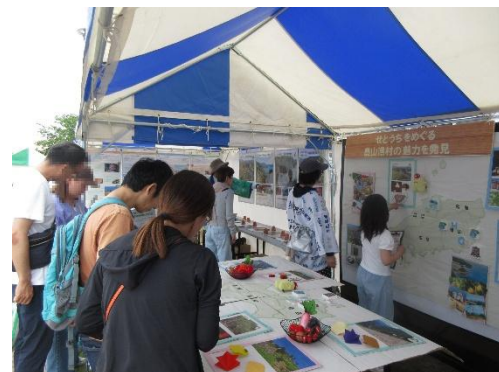
PRブースの出店者例