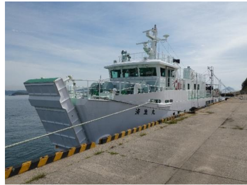
はたらく船展(せとうち島旅フェス 2025)