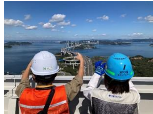
瀬戸大橋塔頂体験ツアー(せとうち島旅フェス 2025)