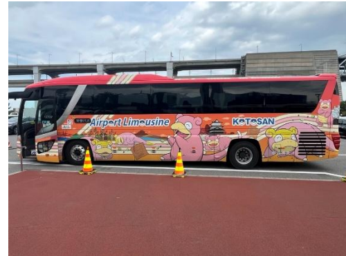
ヤドンバス(せとうち島旅フェス 2025)

香川県の公式PRキャラクター「ヤドン」がデザインされたヤドンバスが、与島PAの第1駐車場と第2駐車場を無料シャトルバスとして運行します。「はたらく船展」や「島旅クルーズ」へお越しの際は、ぜひヤドン号をご利用ください。