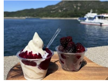
讃岐広島 江の浦地区