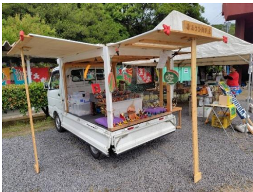
物産ブースの出店者例

https://www.love-setouchi.jp/shimafes2026/