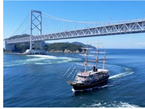
新咸臨丸クルーズ

イベントの詳細は、特設サイト・せとうち魅力発見キャンペーン事務局 Instagram で随時 発信中です！