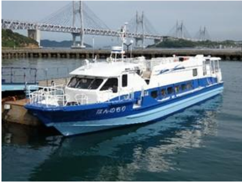
こども図書館船「ほんのもり号」