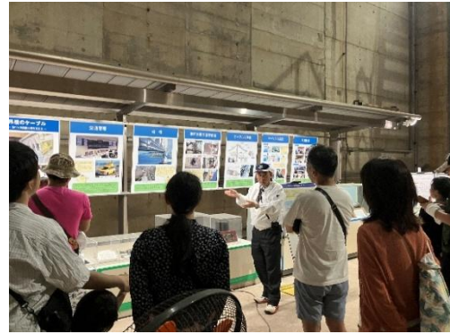
アンカレイジツアー(せとうち島旅フェス 2025)