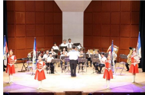
ステージイベントの例(香川県警察音楽隊)