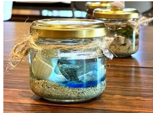
ワークショップのイメージ(貝殻などのハーバリウム作り)

コース② 日本近代化を支えた北木島～光と石の文化紀行～〈サテライト会場：北木島(岡山県笠岡市)〉