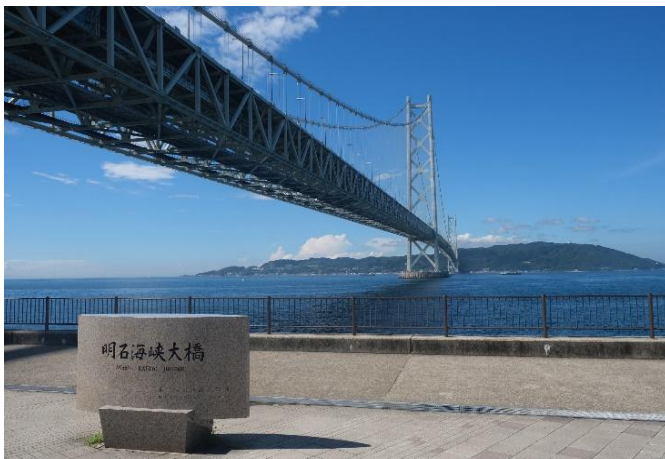
明石海峡大橋（神戸側より）

※7月～9月分開催分のお申込みも引き続き受付中です。ぜひあわせてご検討ください。