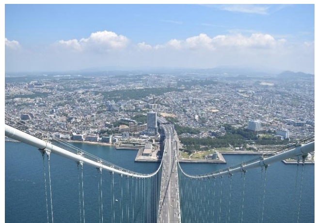
神戸側主塔(2P)からの風景（神戸側を望む）