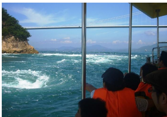
しまなみ来島海峡遊覧船

「くる(来)」島海峡を遊覧船で「くるくる」周り、塔頂へ登る(クライム)ツアーコースを想像でき、より当ツアーに親しみをもっていただけるよう、愛称を「くるくるクライム」に決定いたしました。