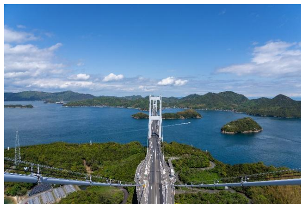
来島海峡大橋塔頂体験