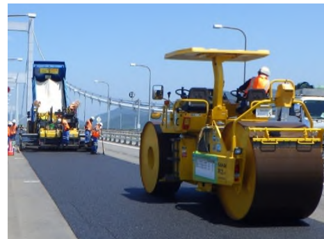
来島海峡大橋 舗装補修工事 (西瀬戸自動車道)