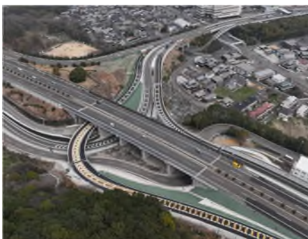
坂出北 IC フルインター化工事 (瀬戸中央自動車道)