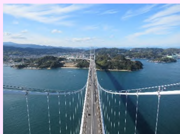
来島海峡遊覧船&塔頂体験 くるくるクライム