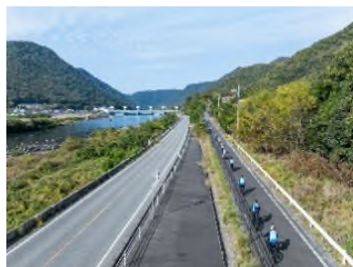
Setouchi Vélo 協議会