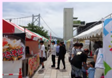
せとうち島旅フェス2025 (与島PA)