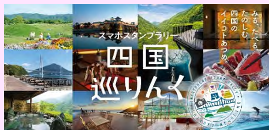
スマホスタンプラリー 四国巡りんく