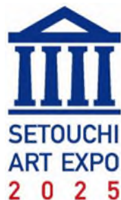
せとうちアートエキスポ2025