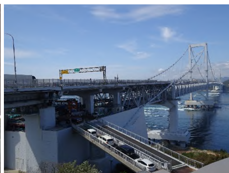
自転車道設置工事 (兵庫県・徳島県/大鳴門橋)