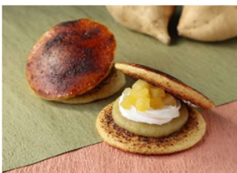
地元の大学と連携して開発した商品 (来島海峡 SA/「ごろっと七福芋ブリュレどら焼き」)