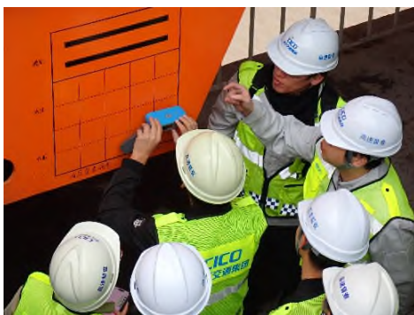
長大橋技術支援 (中国/西堍門大橋 しほづめん )