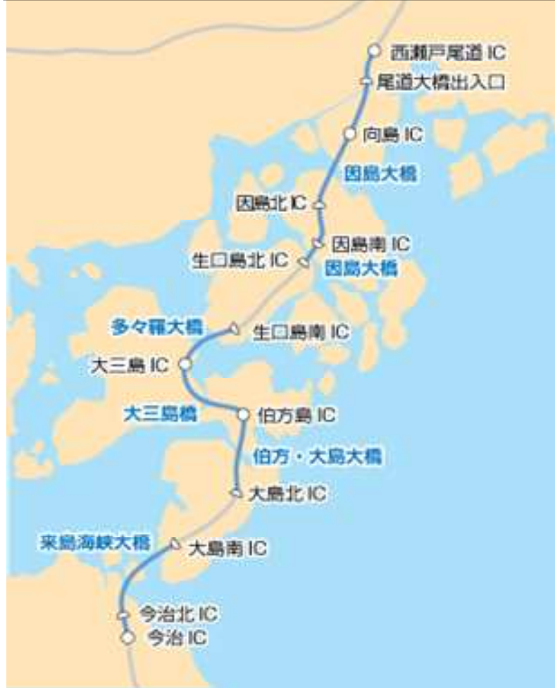
E 3 0 瀬戸中央自動車道