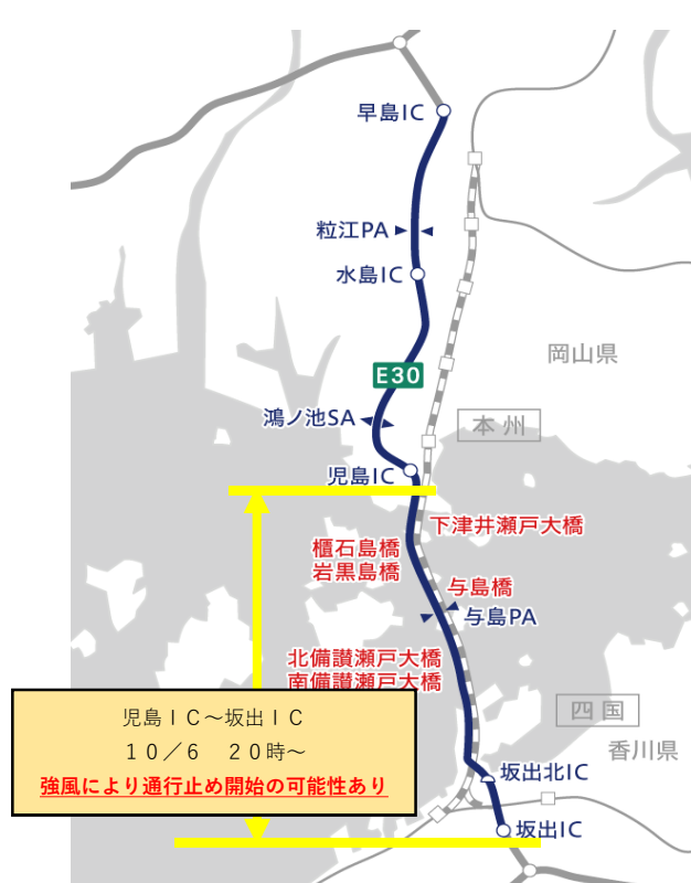
E 3 0 瀬戸中央自動車道