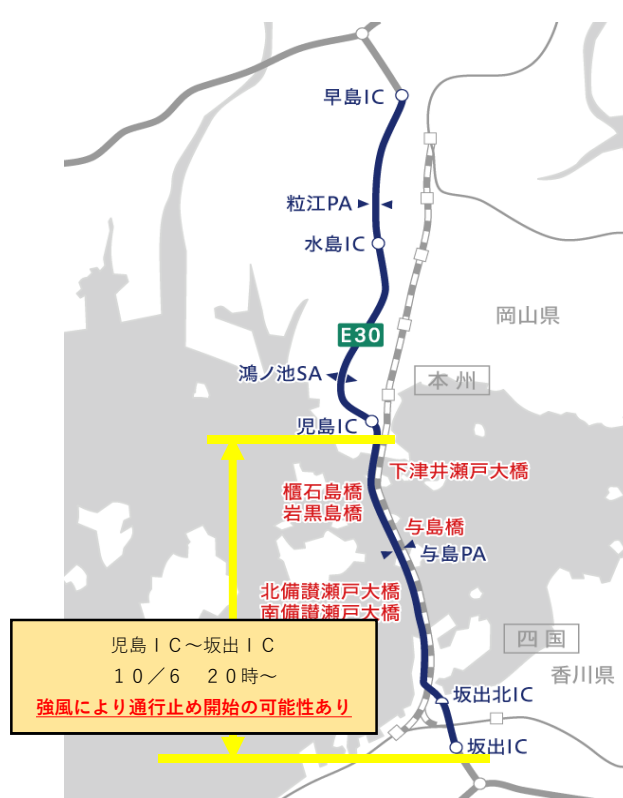
E 3 0 瀬戸中央自動車道