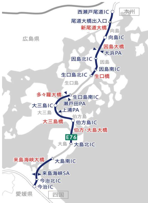
E 7 6 西瀬戸自動車道