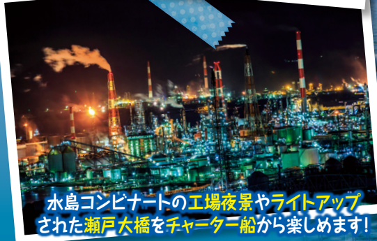
水島コンビナートの工場夜景やライトアップされた瀬戸大橋をチャーター船から楽しめます!