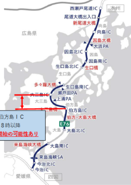
E 7 6 西瀬戸自動車道

⑤大三島IC~伯方島IC 8/15 8時以降 強風により通行止め開始の可能性あり