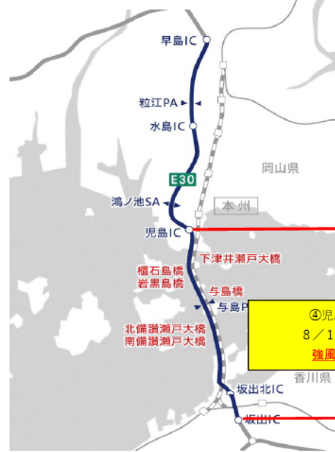
E 3 0 瀬戸中央自動車道

⑤大三島IC~伯方島IC 8/15 8時以降 強風により通行止め開始の可能性あり