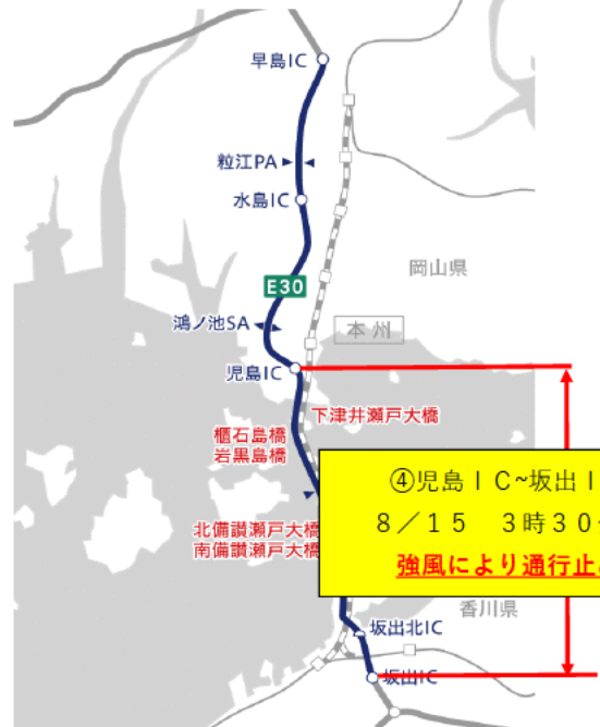
E 3 0 瀬戸中央自動車道