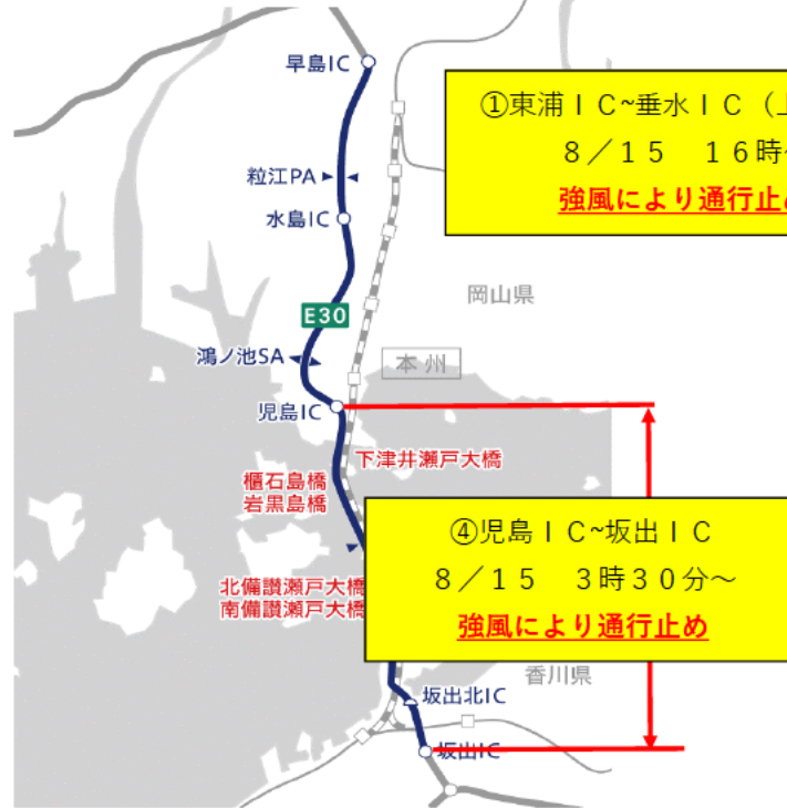
E 3 0 瀬戸中央自動車道