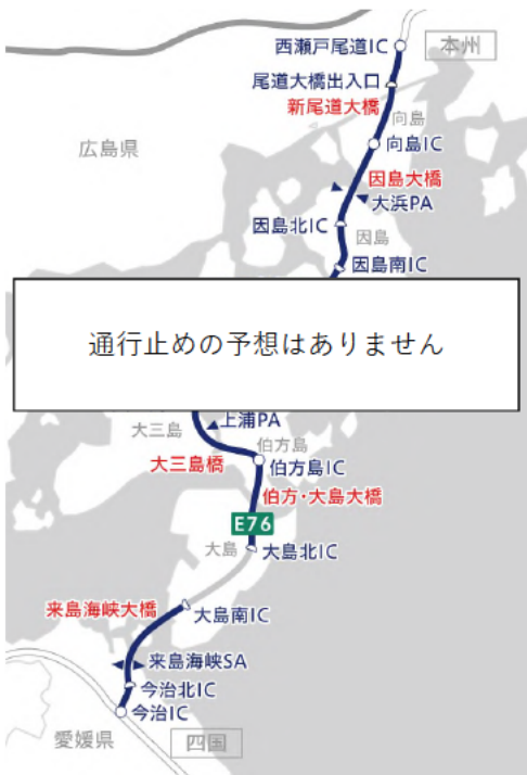
E 7 6 西瀬戸自動車道