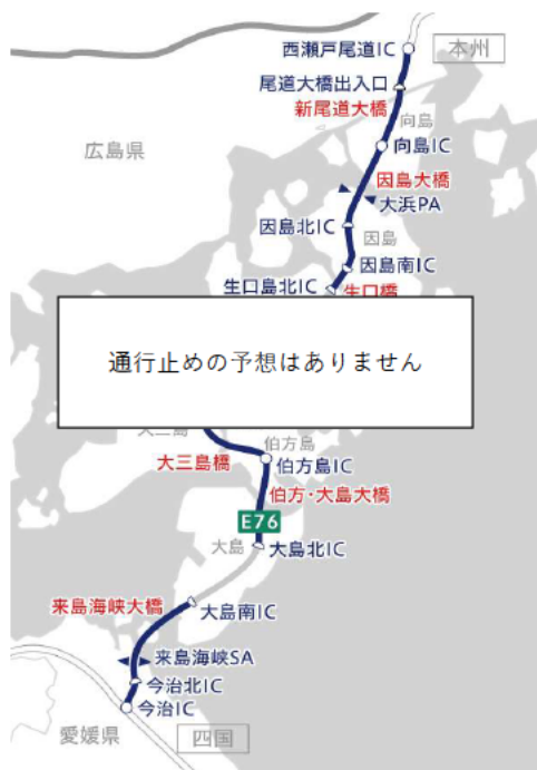
E 7 6 西瀬戸自動車道