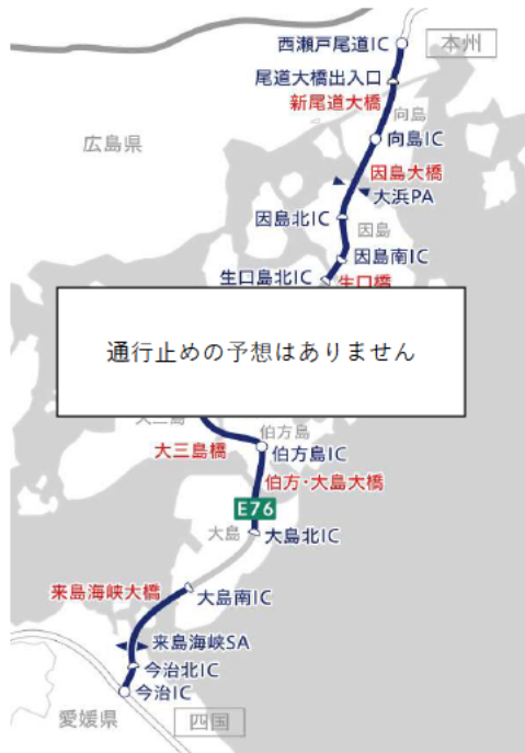
E 7 6 西瀬戸自動車道