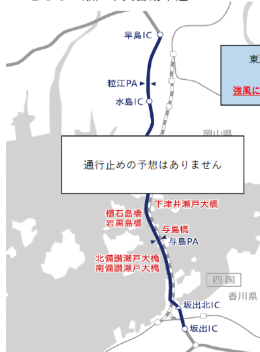
E 2 8 神戸淡路鳴門自動車道