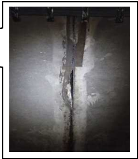
(コンクリート片落下箇所)