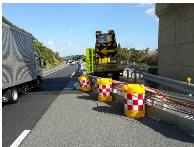
仮設防護柵の設置(過年度実施事例)