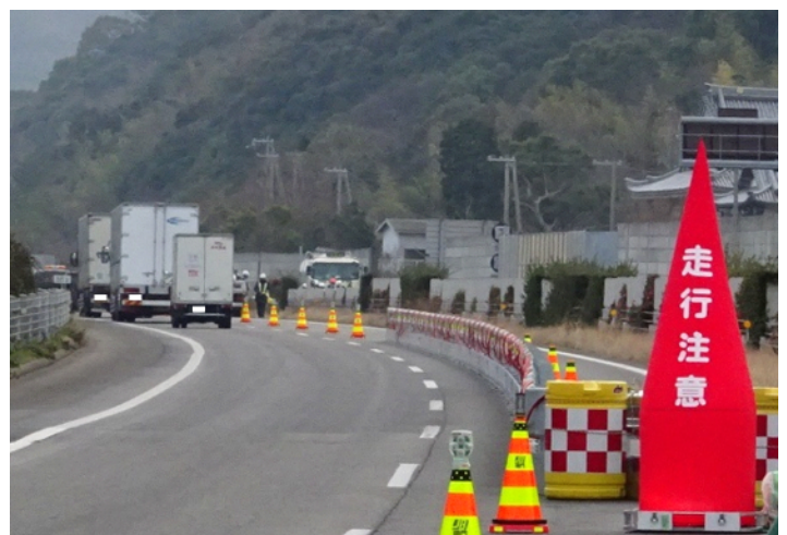
仮設防護柵の設置(過年度実施事例)