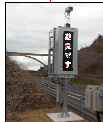
※写真中の文字はイメージです