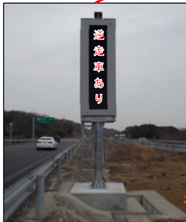
※写真中の文字はイメージです