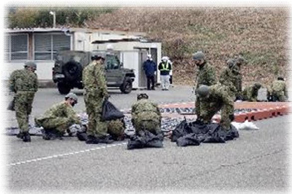
路面段差応急復旧訓練