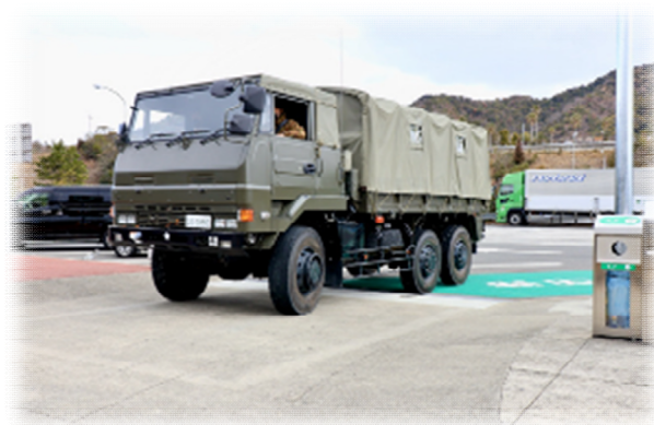
緊急開口部通行訓練