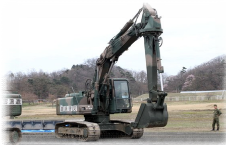
陸上自衛隊保有の施設器材