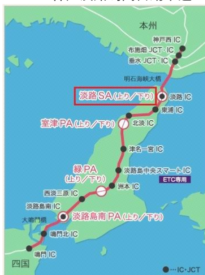
E28 神戸淡路鳴門自動車道