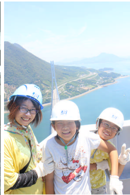
多々羅大橋塔頂等からの眺めを楽しむ