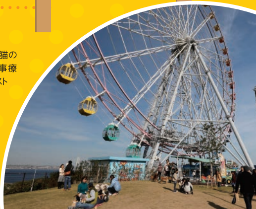
淡路SA下り線ドッグラン施設