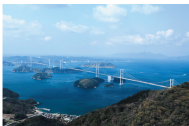
お題⑦「来島海峡大橋」