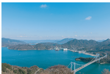
お題⑥「伯方・大島大橋」