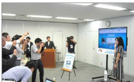
※高速道路ドライブアドバイザー(中日本)