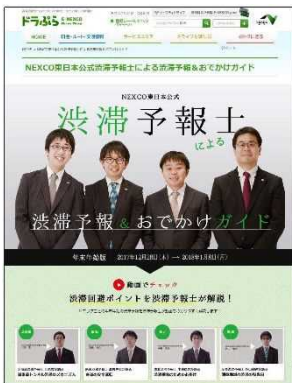
※渋滞予報士(東日本)