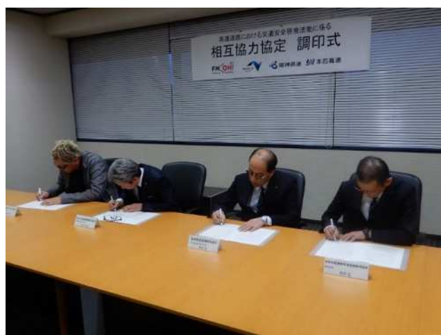
【2019年11月18日「高速道路における交通安全啓発活動に係る相互協力協定」調印式の様子】

○2020年4月から実施する「STOP! NAGARA DRIVING PROJECT」は、本協定に基づき実施するものとなります。