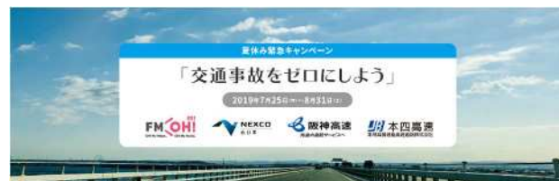
【夏休み緊急キャンペーン「交通事故をゼロにしよう」イメージ写真】