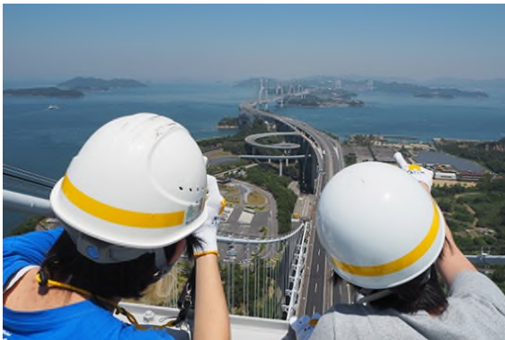
瀬戸大橋塔頂から本州側を望む

2022 年 4 月～6 月及び 10 月・11 月の金・土・日曜日及び祝日（各日とも 1 日 2 回〔午前の部・午後の部〕）のうち、当社が指定する日