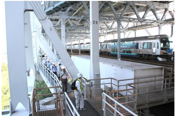
管理路より瀬戸大橋線を望む