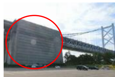
普段は立ち入れないアンカレイジ内部を公開！