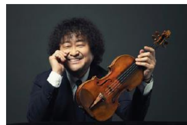
葉加瀬太郎ミニライブ