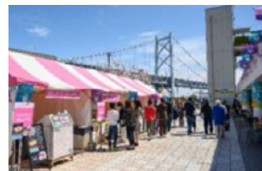
せとうちマルシェ