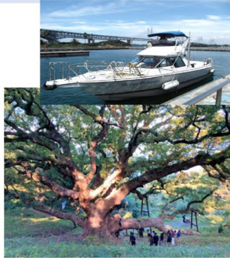
県の天然記念物に指定されている大楠