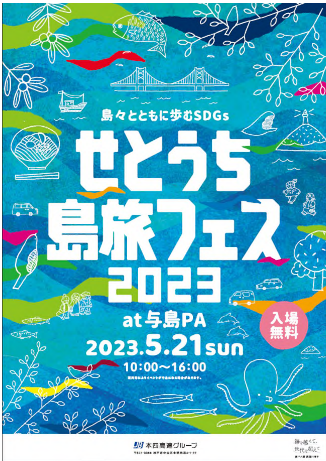
【別添1】 イベントポスター