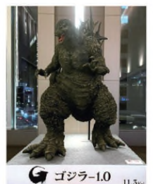
ゴジラ-1.0 11.3 Fri