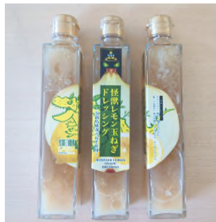
【怪獣レモン玉ねぎドレッシング】