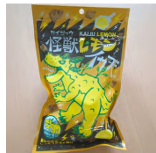
【怪獣レモンイカ天】