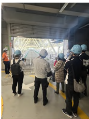
ちびっこブリッジワールド（2024年5月11日イベント開催時）