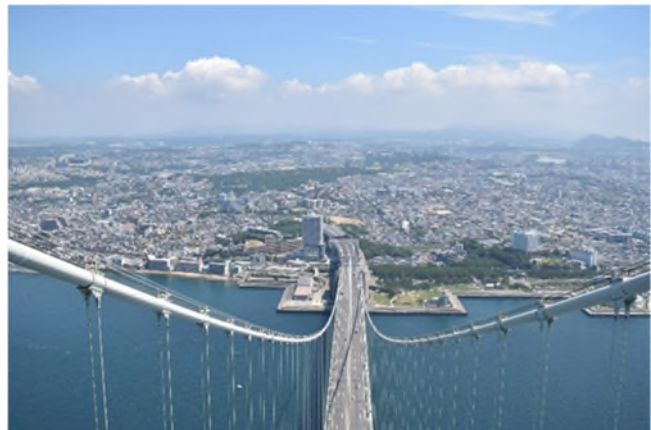
神戸側主塔（2P）からの風景（神戸側を望む）