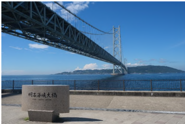
明石海峡大橋（神戸側より）

テレビ番組等でも取り上げられ、人気殺到のツアーです。多くの皆さまのご参加をお待ちしております。