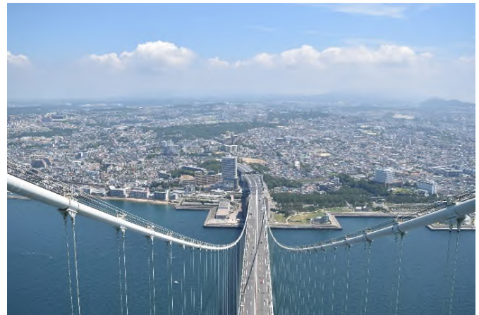
神戸側主塔(2P)からの風景（神戸側を望む）