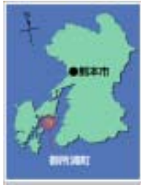
図-3 位置図 (Fig.3 Location)