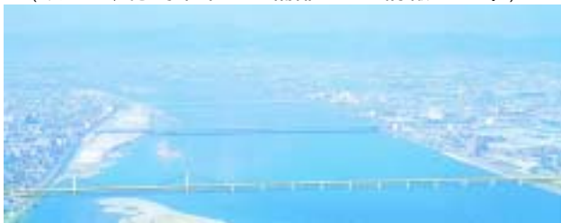
図-6 東環状道路完成予想図 (Fig.5 Computer Graphic)

らの現地施工に向け準備を行っているところです。 (以上は、徳島県県土整備部からの情報による。)