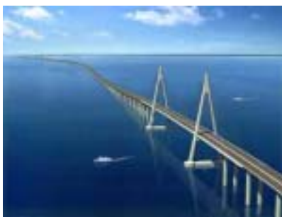
図-7 杭州湾大橋完成予想図 (Fig.7 Computer Graphic)