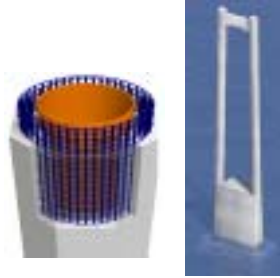
図-4 主塔構造 (Fig.4 Structure of tower)