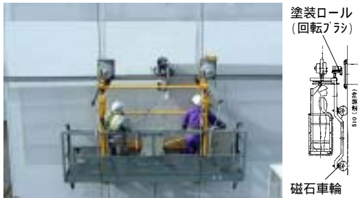
写真-1 塗装装置による塗装作業状況 (Photo.1 Painting robot for tower)

今回の主塔用塗装装置は、先に開発した磁石式ゴンドラと箱桁用塗装装置で得たノウハウを結集して開発したものです。開発にあたり生じた多くの課題は室内実験によって解決しました。その後、因島大橋の主塔において実際に塗替塗装を行い、塗装品質・作業性・作業能率などを確認しました。この実橋実験により、塗装の品質は人力塗装と同等であり、均一性では人力よりも優れていることが分かりました。また運転人員2名で作業能率は500㎡/日(10人/日に相当)以上あり、経済性・安全性の向上とともに大幅な省力化を実現しました。