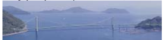
図-5 御所浦第2架橋完成予想図 (Fig.5 Computer Graphic)

After the deliberation about the detail of the towers (joints of horizontal beams and base of the anchor) in the technical committee, the detail design is planned to be completed in this fiscal year. Preparation for the construction of the main bridge is proceeding taking into account the progress of the approach road.