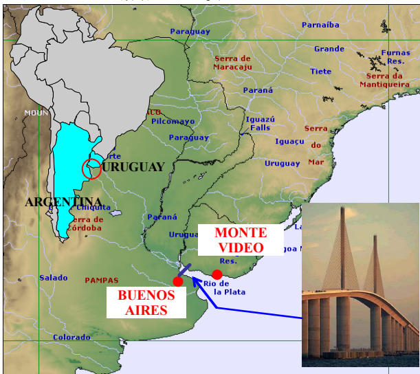
図-1 位置図 (Fig.1 Location)

このプロジェクトは BOT 方式で実施され、現段階において、7つの国際的企業体が応札資格を得ています。しかし、入札手続を行うためには二国間条約の議会での批准が必要です。ウルグアイでは済んでいます、アルゼンチンでは現在審議中です。（以上はアルゼンチンーウルグアイ二国間委員会 レペット氏からの情報による。）