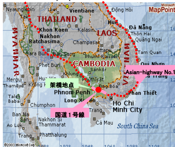
図-2 位置図 (Fig.2 Location)

The highway section between the bridge and Vietnam border is now under construction by surface treatment funded by ADB, while section between the bridge and Phnom Penh is planned to be rehabilitated by Japanese Grant Aid. The Study on The Construction of The Second Mekong Bridge has just started in 2004 by Japanese Grant Aid.