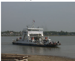
写真-2 第二メコン架橋予定地のフェリー

現在、国道1号線は、架橋地点よりベトナム国境までの約110kmについては、ADB(アジア開発銀行)の支援により簡易舗装による整備が、プノンペン側約55kmについては、整備に向け日本の無償資金協力による開発調査が行われています。第二メコン架橋は、2004年度より日本の無償資金協力による開発調査が実施されています。