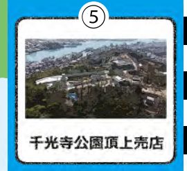
千光寺公園頂上売店