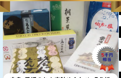
広島・愛媛のお土産詰め合わせ 5名様