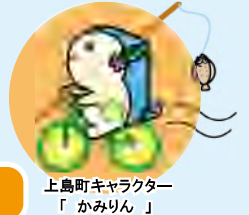
上島町キャラクター「かみりん」